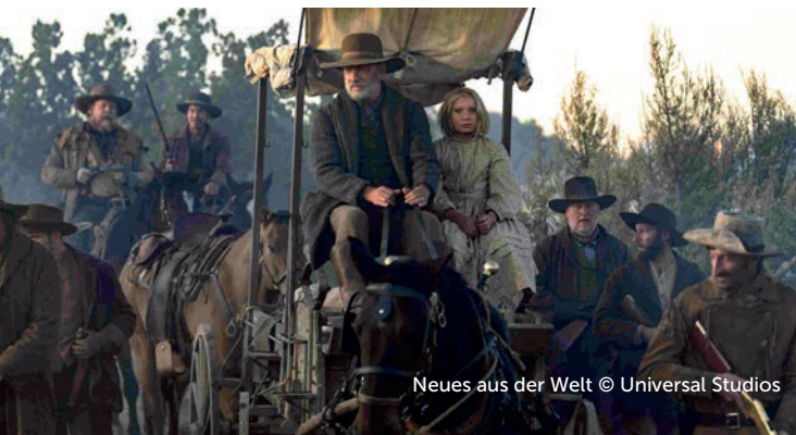
Neues aus der Welt