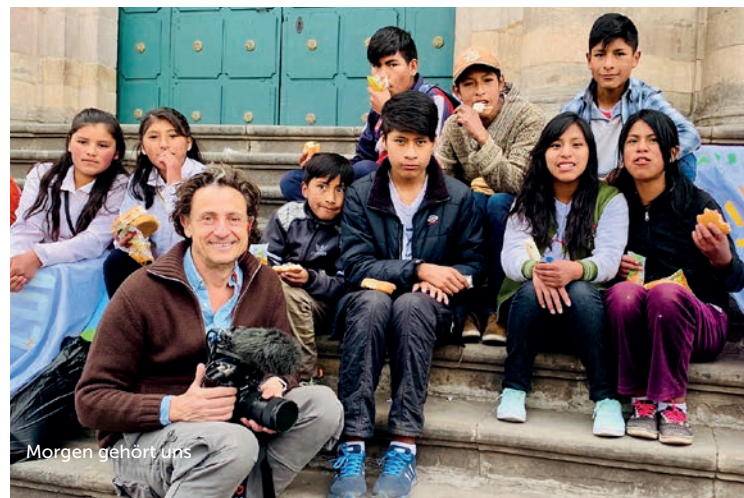
Morgen gehört uns